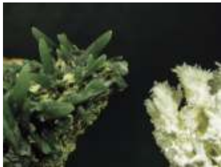
1. saria / premio: Gazetxoak / jóvenes: AMETS KARRERA