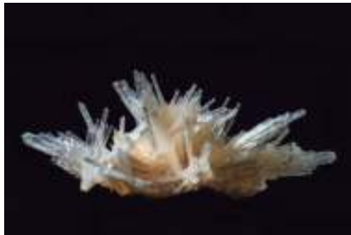
1. saria / premio: JESUS HERAS