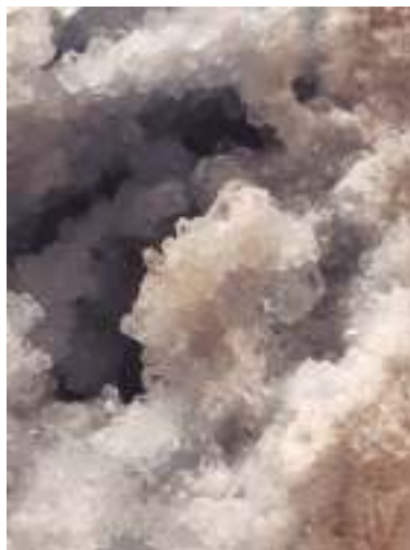
Gazetxoak / jóvenes: 2. saria / premio: OIER AZURMENDI