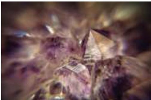
2. saria / premio: IKER GUTIERREZ