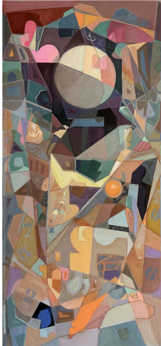
130 x 60 cm. Arrautza tenpera / temple huevo s/AF. 2024