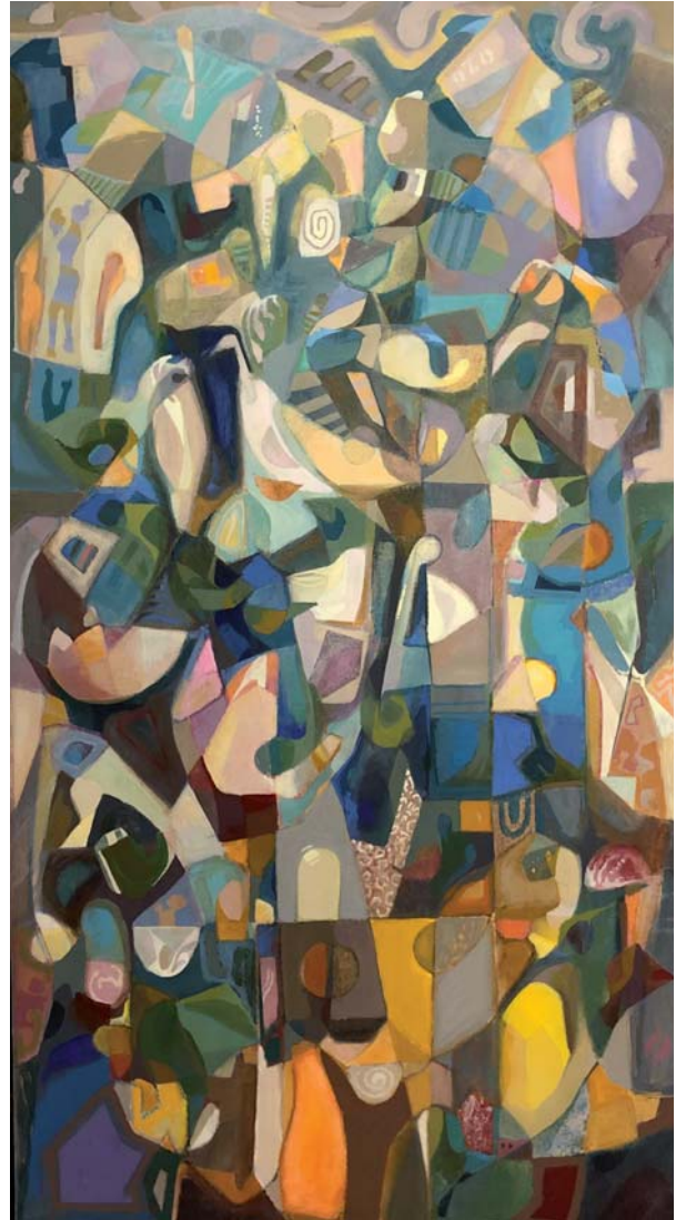
100 x 54 cm. Arrautza tenpera / temple huevo s/AF. 2024