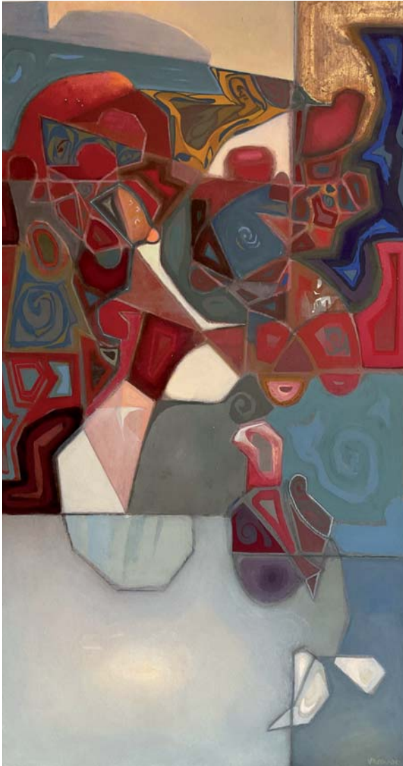
100 x 54 cm. Arrautza tenpera / temple huevo s/AF. 2024