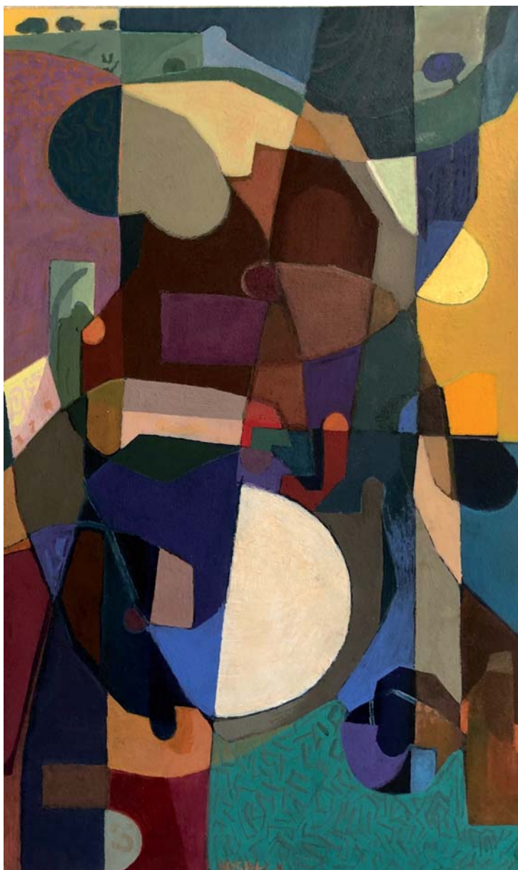
60 x 36 cm. Arrautza tenpera / temple huevo s/AF. 2024