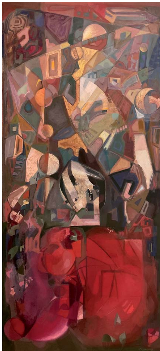
100 x 46 cm. Arrautza tenpera / temple huevo s/AF. 2024