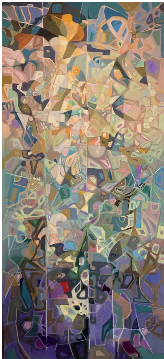
130 x 60 cm. Arrautza tenpera / temple huevo s/AF. 2024