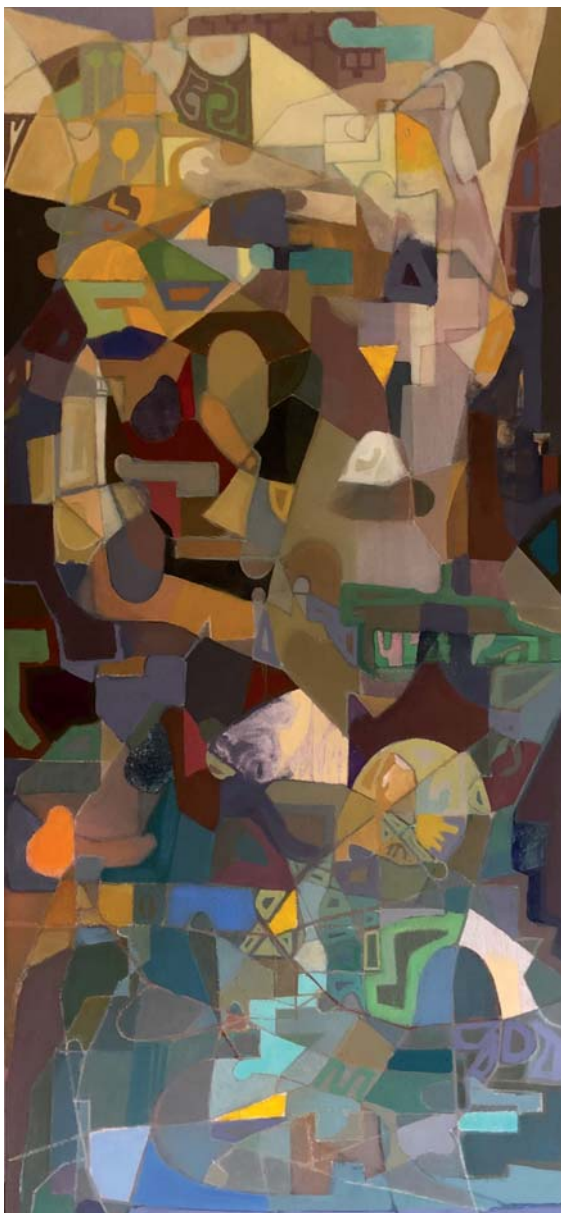
100 x 46 cm. Arrautza tenpera / temple huevo s/AF. 2022