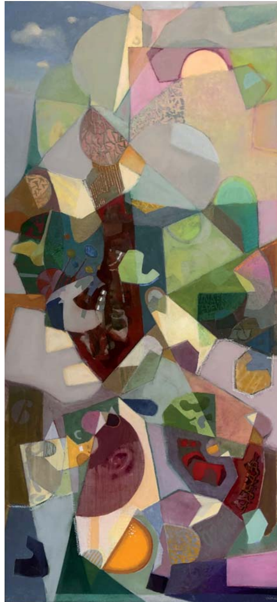
100 x 46 cm. Arrautza tenpera / temple huevo s/AF. 2024