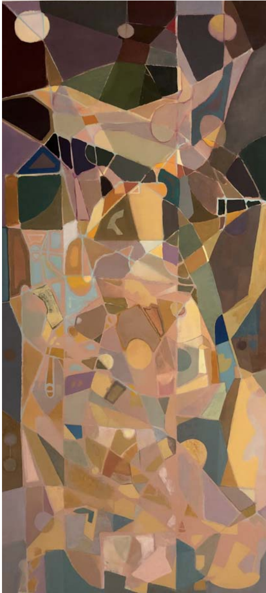
100 x 46 cm Arrautza tenpera / temple huevo s/AF. 2023