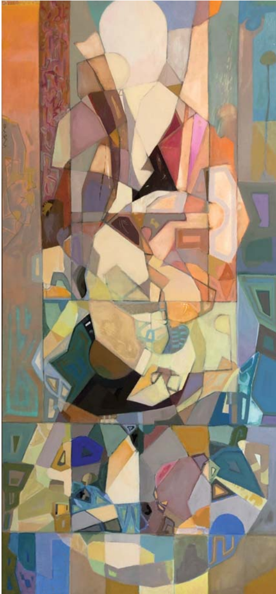
130 x 60 cm. Arrautza tenpera / temple huevo s/AF. 2023