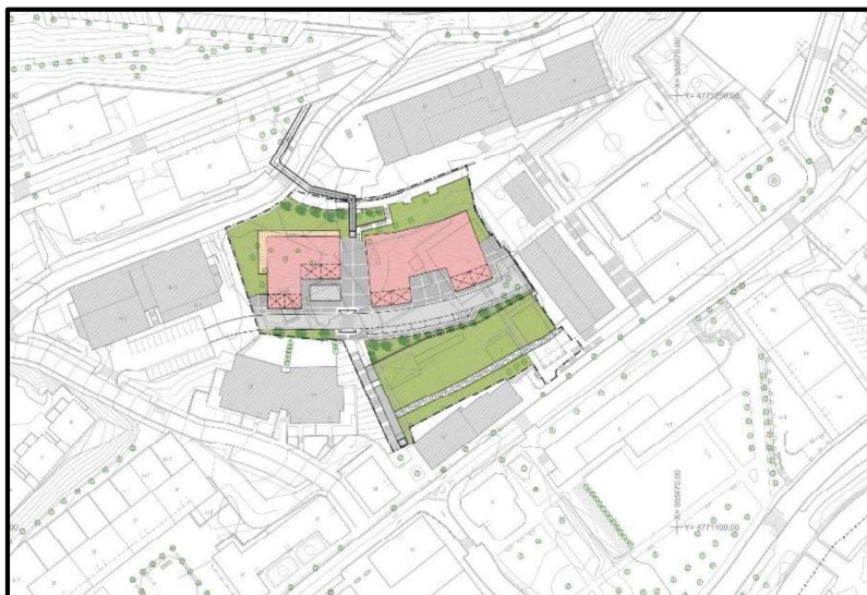
Gráfico 4. Alternativa 2. Ordenación en planta.

Su contenido se refleja en los planos "5.2.1" y "5.2.2" de este documento, así como en los siguientes gráficos.