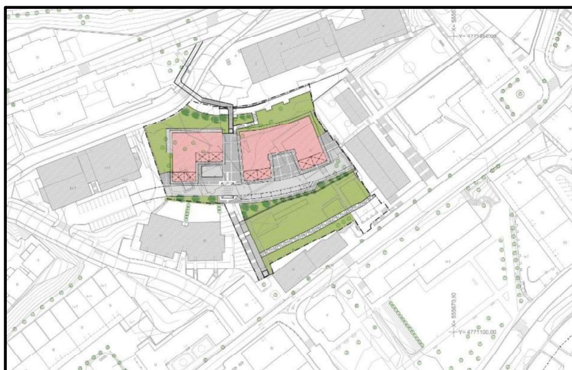
Gráfico 2. Alternativa 1. Ordenación en planta.

Implica el mantenimiento del régimen urbanístico vigente en el subámbito en los términos establecidos en el planeamiento urbanístico vigente, expuestos de manera sintetizada en el epígrafe IV (apartado 2). Su contenido se refleja en los planos "5.1.1" y "5.1.2" de este documento, así como en los siguientes gráficos.