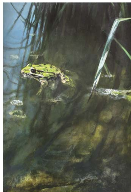
Ólio papel gainean 45 x 30 cm Óleo sobre papel 45 x 30 cm

Portadako margolanak / Cuadros en portada Ólio paper gainean 60 x 33 cm Óleo sobre papel 60 x 33 cm