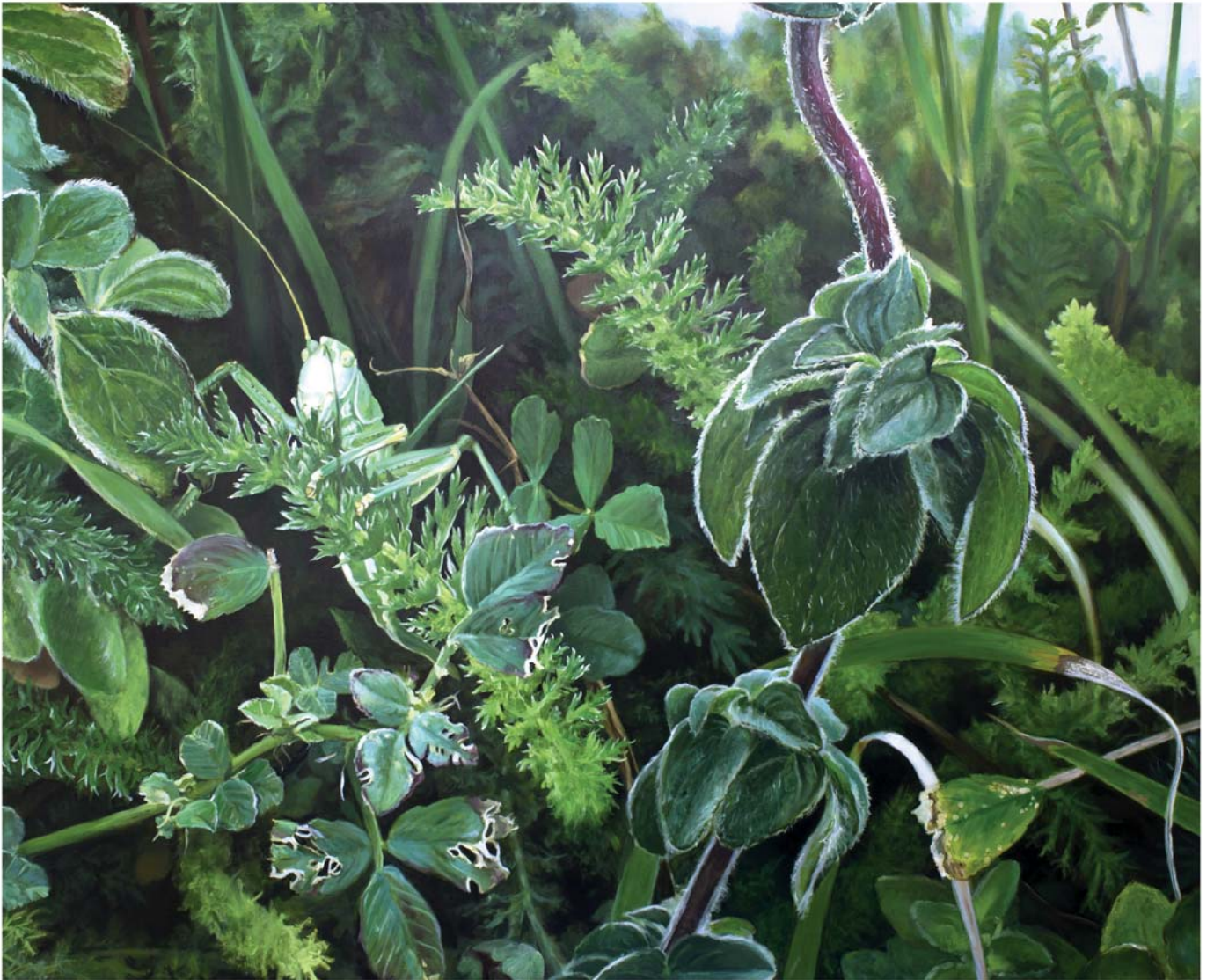
Olio mihi se ganean 130 x 162 cm Óleo sobre lienzo 130 x 162 cm