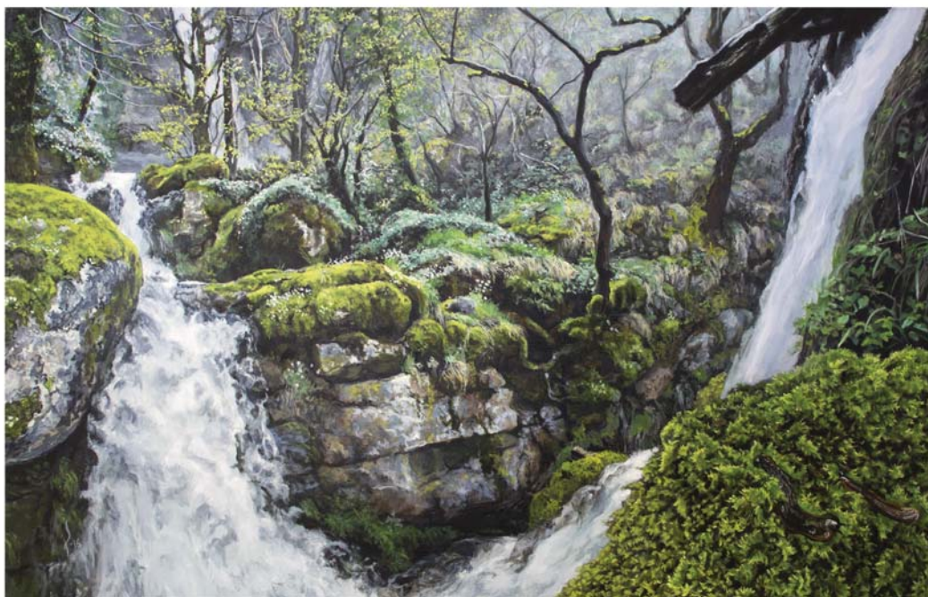
Olio mihise gainean 73 x 116 cm Óleo sobre lienzo 73 x 116 cm