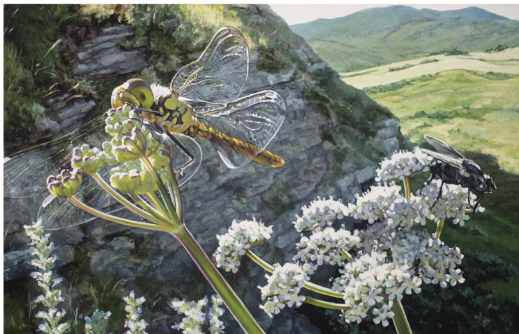
Ólio mihi se gainean 73 x 116 cm Óleo sobre lienzo 73 x 116 cm