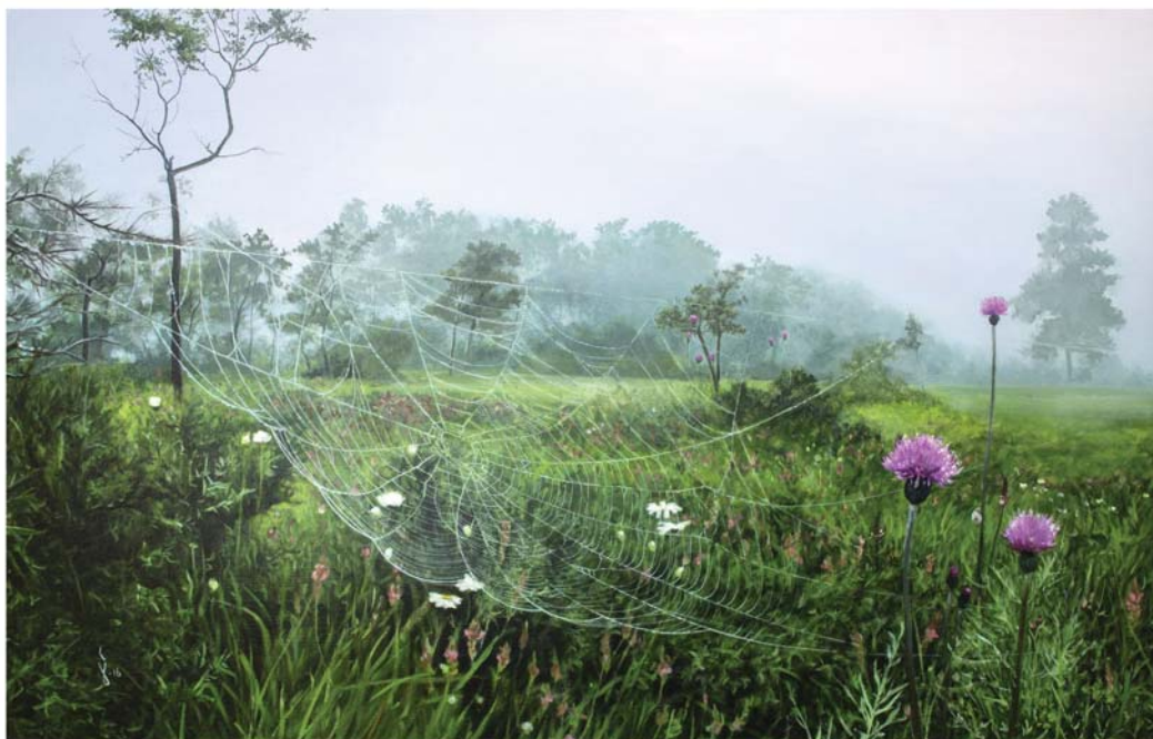
Olio mihise gainean 73 x 116 cm Óleo sobre lienzo 73 x 116 cm