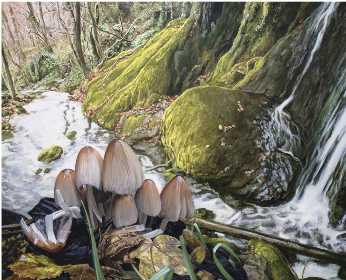
Olio mihiše gainean 130 x 162 cm Óleo sobre lienzo 130 x 162 cm