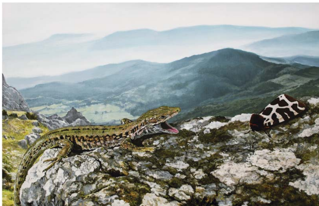
Ólio mihi se gainean 73 x 116 cm Óleo sobre lienzo 73 x 116 cm