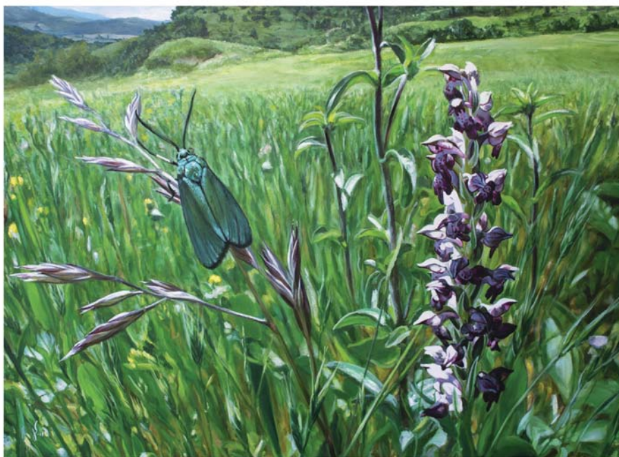
Ólio mihi se gainean 73 x 100 cm Óleo sobre lienzo 73 x 100 cm