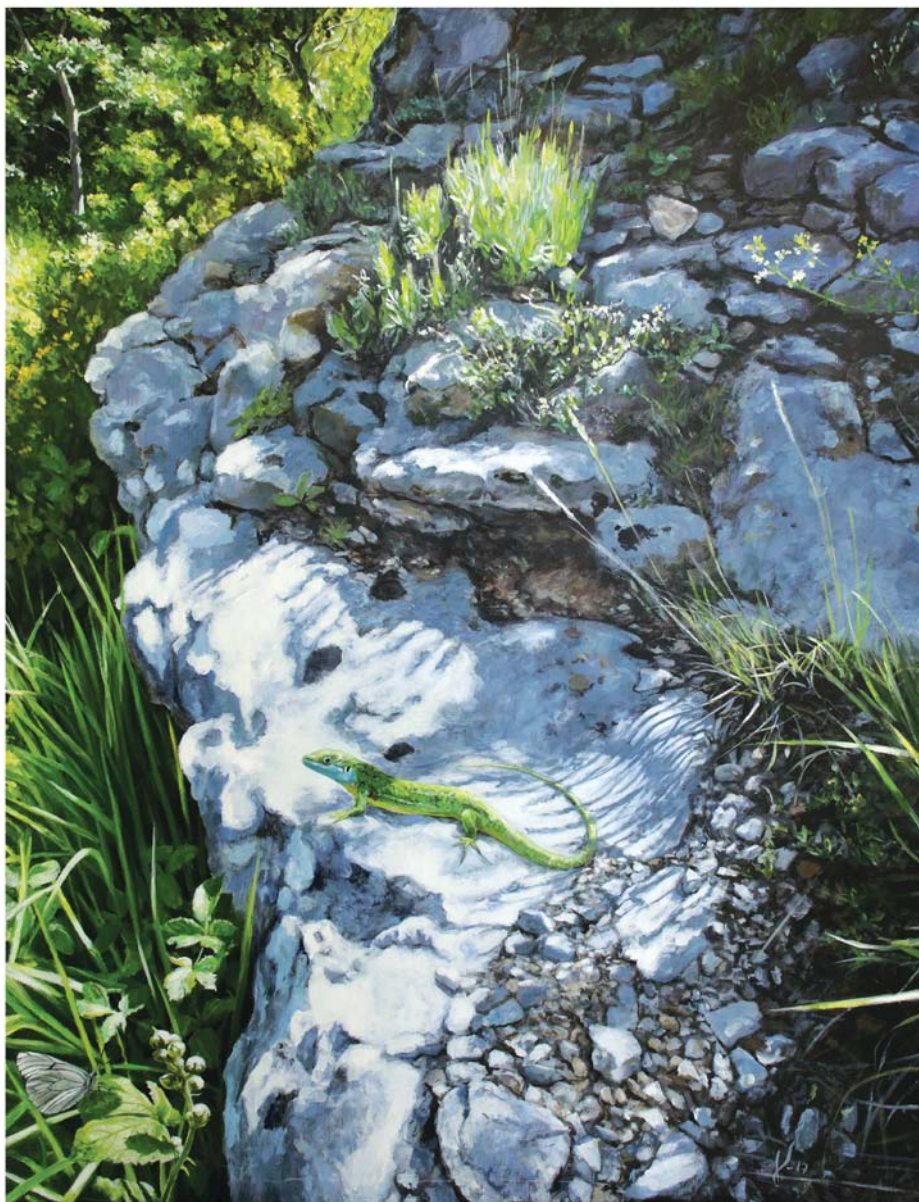
Olio mihi se gainean 116 x 89 cm Óleo sobre lienzo 116 x 89 cm