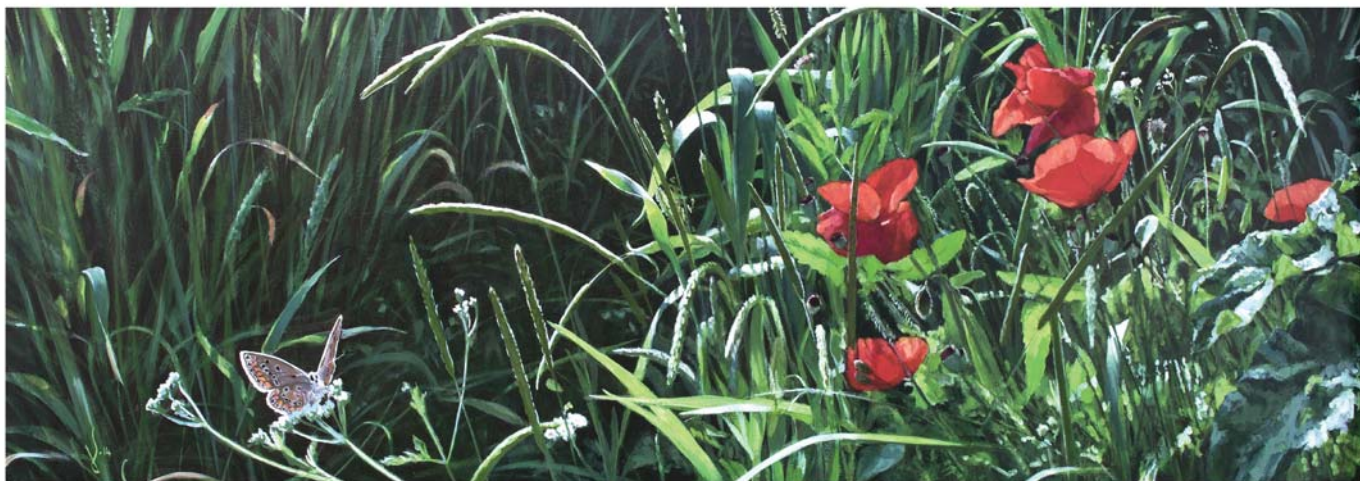
Olio egur gainean 40 x 120 cm Óleo sobre madeira 40 x 120 cm