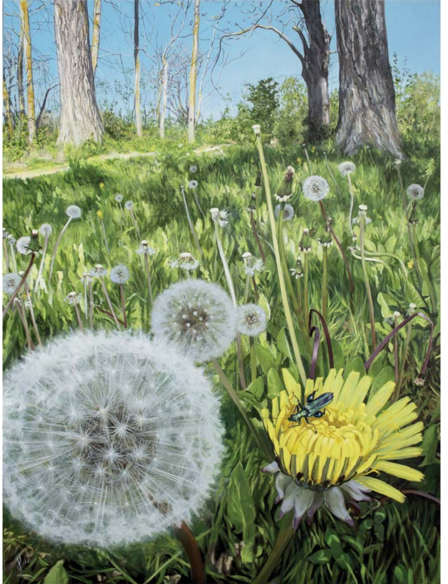
Olio mihi se gainean 100 x 73 cm Óleo sobre lienzo 100 x 73 cm