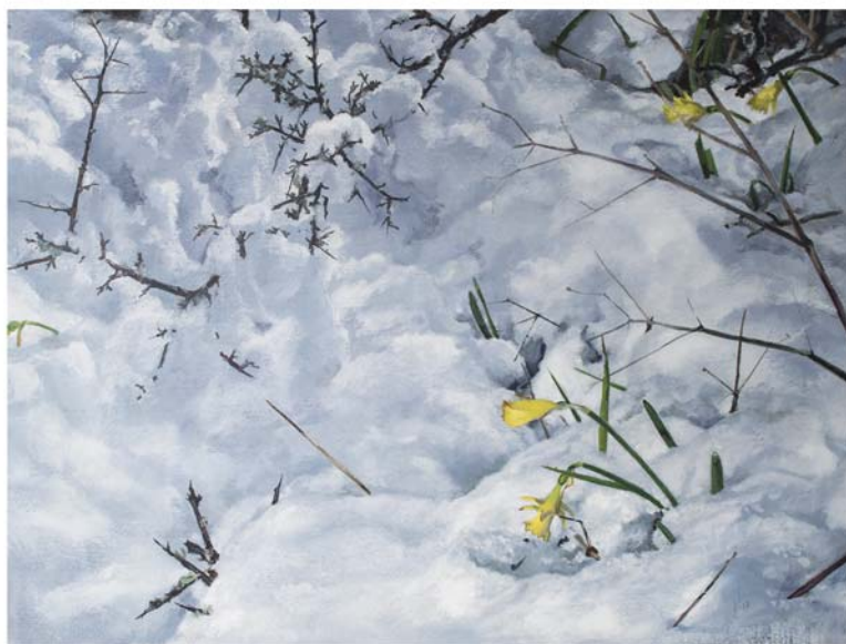
Ólio paper gainean 56 x 76 cm Óleo sobre papel 56 x 76 cm