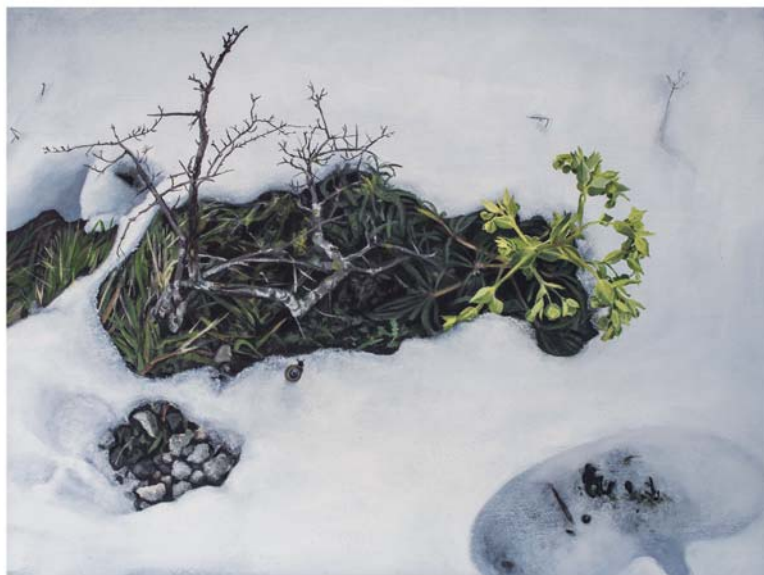
Ólio paper gainean 56 x 76 cm Óleo sobre papel 56 x 76 cm